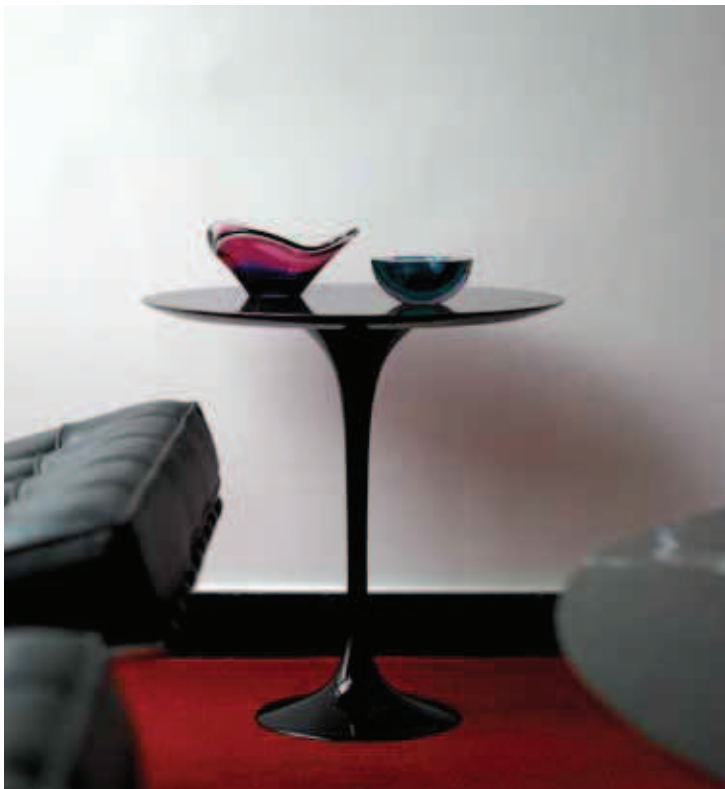
MK134

SAARINEN KOFFIE- EN BIJZETTAfels In zijn zuiverende aanpak zocht Eero Saarinen naar het essentiële idee in de architectuur en reduceerde hij dit tot de meest effectieve structurele oplossing binnen een algemene eenheid van design. "De onderkant van gewone stoelen en tafels creëren een verwarrende, onrustgevende wereld," legde Saarinen uit. "Ik wou de krottenwijk van poten opruimen." In zijn basiscollectie, die eet-, koffie-, en bijzettafels omvat, verwezenlijkte Saarinen zijn ideaal van formele eenheid.