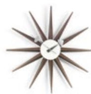
Sunburst Clock, noir, Ø 470