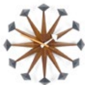
Polygon Clock, noyer, Ø 430