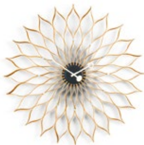
Sunflower Clock, bouleau, Ø 750