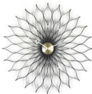
Sunflower Clock, frêne noir/laiton, Ø 750