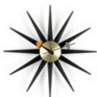
Sunburst Clock, noir/laiton, Ø 470