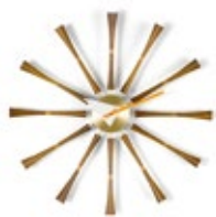
Spindle Clock, aluminium, noyer massif, Ø 577