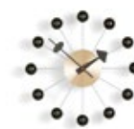
Ball Clock, noir/laiton, Ø 330