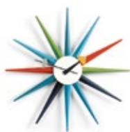
Sunburst Clock, multicolore, Ø 470