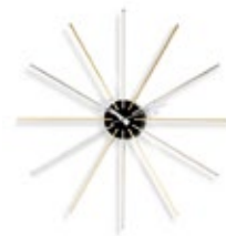
Star Clock, chrome/laiton, Ø 610