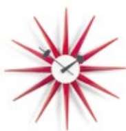
Sunburst Clock, rouge, Ø 470