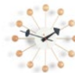
Ball Clock, naturel, Ø 330