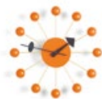
Ball Clock, orange, Ø 330