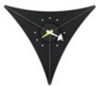
Triangle Clock, polystyrène, 520 x 450 mm