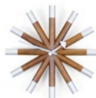
Wheel Clock, noyer/aluminium, Ø 455