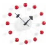
Ball Clock, rouge, Ø 330