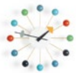
Ball Clock, multicolore, Ø 330