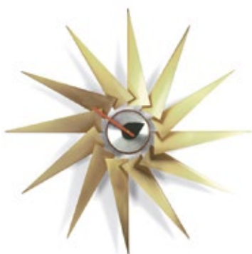
Turbine Clock, laiton/aluminium, Ø 765