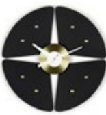
Petal Clock, noir/laiton, Ø 448