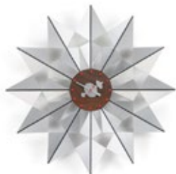
Flock of Butterflies, aluminium, Ø 610