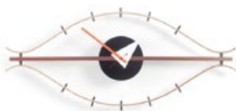
Eye Clock, laiton/noix, H 340 x L 760